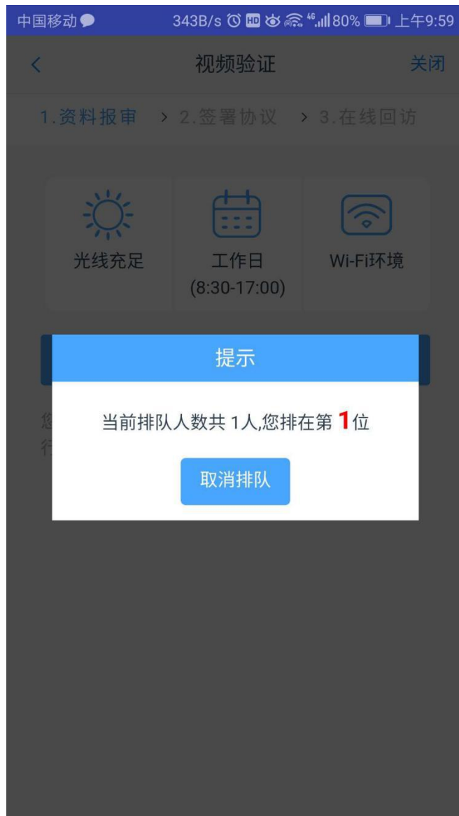
图 9 视频排队