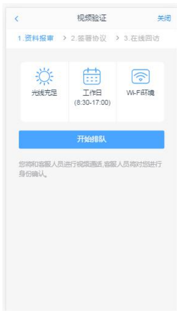
图 8 视频认证

客户点击“开始视频通话”，会出现一个排队页面，此页面显示的人数是当前营业部所有用户的数量，包括本人。视频排队界面如图 9 所示。