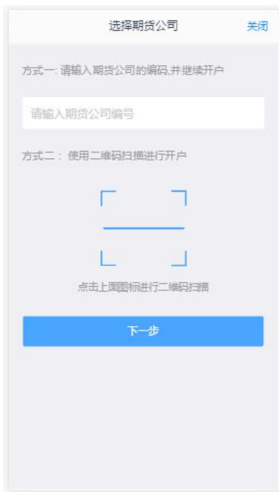
图 1 输入期货公司编号页

打开开户云 app，登录以后会出现如图 1 所示的页面，直接在输入框输入期货公司编号 0038 进行业务办理。