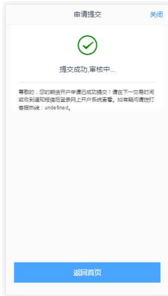
图 7 修改结算账户提交