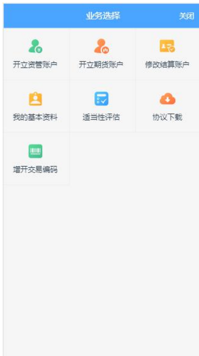
图 2 业务选择页面