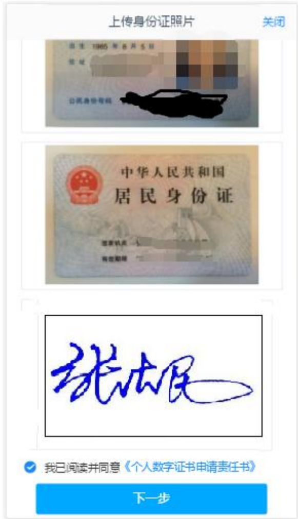
图 4 上传身份证页面

进入到上传照片页面，根据按钮提示上传身份证正面、反面和签名照等图片，上传的照片必须是近距离拍摄、画面清楚的，否则会影响到后面获取客户资料的流程。上传照片页面如图 4 所示：