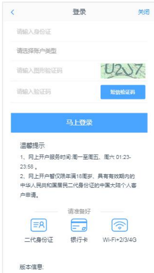
图 3 身份证登录页面