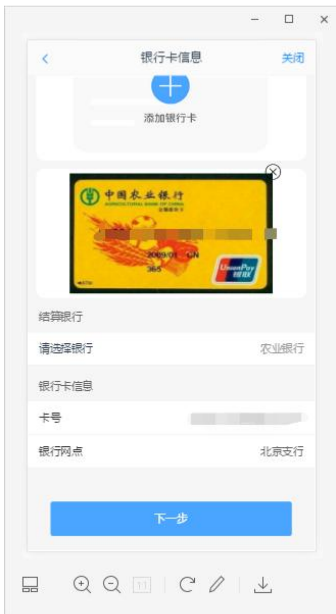
图 5 银期绑定